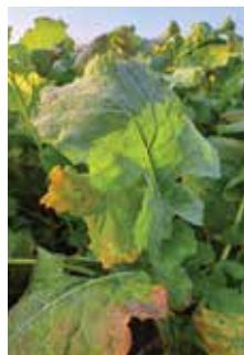
Krmlna ogrščica STARŠKA