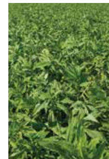
Abesinska gizotija NIGER