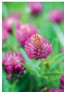
Črna detelja START, ROZETA, RAUNIS