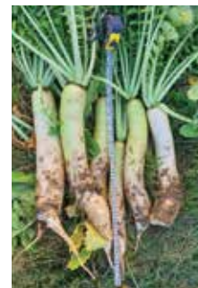
Melirativna redkev STRUKTURATOR, MINO EARLY