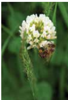
Bela detelja HUJA